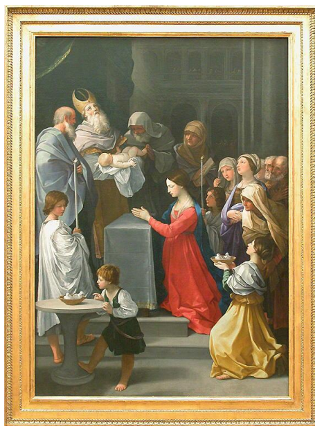
Purification de la Sainte Vierge, école de Guido Reni (2 e quart du XVII e siècle).

P EUT-ÊTRE n'avez-vous pas pu suivre les ultimes rebondissements du mois dernier en matière de protection de la vie. La loi relative à « l'aide à mourir » fut discutée au Sénat, qui modifia plusieurs articles, supprimant en particulier le principe d'une assistance médicale à mourir par suicide assisté et euthanasie. Mais cette loi fut finalement rejetée lors du vote solennel du 28 janvier. Le texte original, celui voté par les députés en mai dernier, sera donc à nouveau examiné par l'Assemblée Nationale au début de février, pour être débattu à partir du 16 février. Ce texte entend instaurer une prétendue « aide à mourir » (euthanasie et suicide assisté). Il est donc de la plus haute importance que nous priions à cette intention et interpellions nos députés. Le mois de février, qui commence par l'épisode de la Purification de la Sainte Vierge, est aussi un mois où l'on peut prier pour la vie ! Rappelons-nous le texte du bel alléluia de cette fête, qui relie les deux âges extrêmes de la vie humaine : « le vieillard portait l'enfant, mais l'enfant gouvernait le vieillard. » Un commentateur écrit : « On pourrait se demander quelle vie, celle du vieillard ou celle du bébé, est la plus fragile ; l'une et l'autre ont leur force et leur fragilité ; l'une et l'autre se rejoignent pour nous donner le respect de toute vie. »